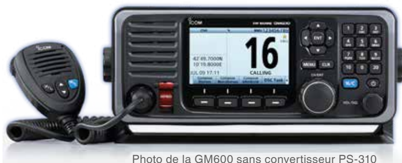
Photo de la GM600 sans convertisseur PS-310