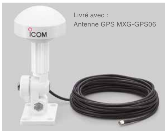
Livré avec : Antenne GPS MXG-GPS06