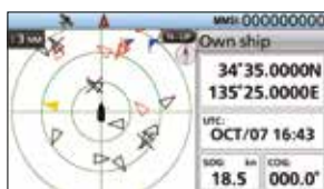
Écran du traceur

L'affichage "mode Jour ou mode Nuit" vous offre une très bonne lisibilité quelles que soient les conditions d'utilisation.