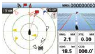
Fonctions de navigation

La fonction de navigation vous guide vers un waypoint ou une cible AIS spécifique. Vous pouvez définir jusqu'à 100 waypoints (destinations favorites, criques, lieux de pêche, etc.).