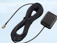
Antenne GPS fournie d'origine