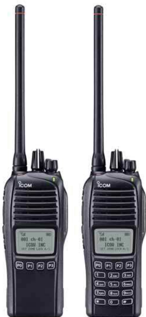
IC-F3262DS (VHF) IC-F4262DS (UHF)