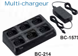
BC-214 Chargeur rapide 6 postes ou batteries