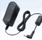
Adaptateur secteur BC-123SE