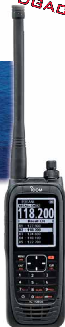
IC-A25NEFRM avec VOR, Bluetooth® et GPS