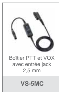
Boîtier PTT et VOX avec entrée jack 2,5 mm