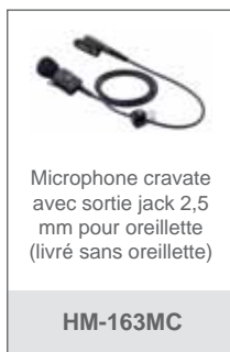
Microphone cravate avec sortie jack 2,5 mm pour oreillette (livré sans oreillette)