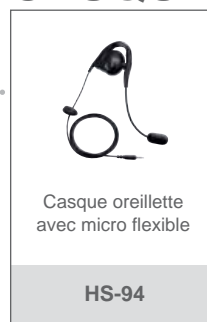
Casque oreillette avec micro flexible