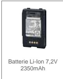
Batterie Li-Ion 7,2V 2350mAh