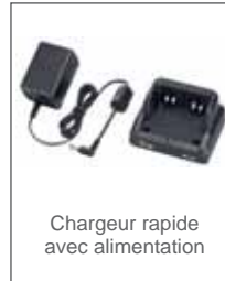
Chargeur rapide avec alimentation