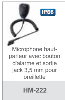
Microphone haut-parleur avec bouton d'alarme et sortie jack 3,5 mm pour oreillette