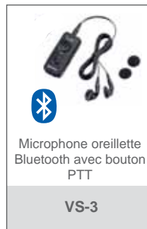
Microphone oreillette Bluetooth avec bouton PTT