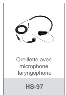
Oreillette avec microphone laryngophone