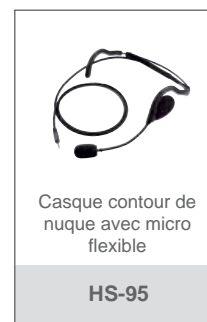
Casque contour de nuque avec micro flexible