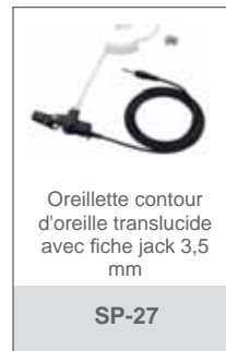
Oreillette contour d'oreille translucide avec fiche jack 3,5 mm