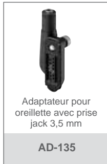
Adaptateur pour oreillette avec prise jack 3,5 mm