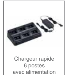
Chargeur rapide 6 postes avec alimentation