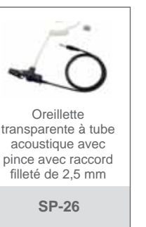
Oreillette transparente à tube acoustique avec pince avec raccord filleté de 2,5 mm