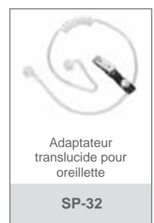
Adaptateur translucide pour oreillette