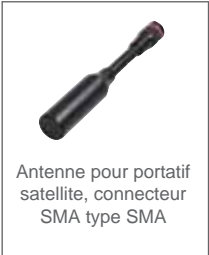
Antenne pour portatif satellite, connecteur SMA type SMA