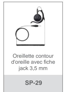
Oreillette contour d'oreille avec fiche jack 3,5 mm