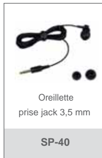
Oreillette prise jack 3,5 mm