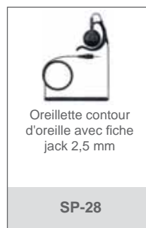
Oreillette contour d'oreille avec fiche jack 2,5 mm