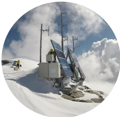
Réseau Radio Sécurité Alerte Mont Blanc

« Ces balises simples d'utilisation sont robustes et répondent aux contraintes de la haute montagne. Au-delà de la fonction d'alerte, les services de secours peuvent lancer des écoutes forcées, faire un appel à la balise pour vérifier si des alpinistes qui sont portés disparus ou non rentrés ne sont pas dans ces abris et éviter ainsi des reconnaissances dans des conditions éventuellement difficiles ».