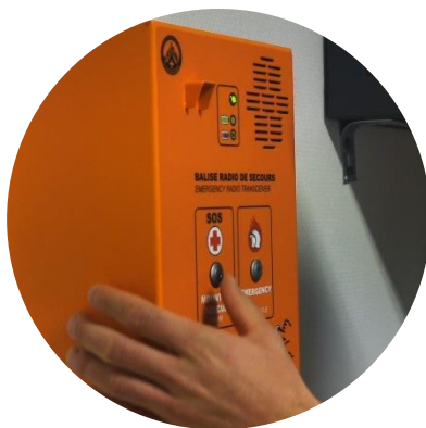
Balise radio fixe installée dans un refuge