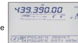
Direction et distance de la station RX

*2 Avec platine optionnelle UT-121 D-STAR. Le récepteur GPS externe peut être connecté via le connecteur data 1. Les données de position peuvent être également saisies manuellement.