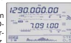
▲Écran scope simple bande

Vous pouvez par exemple organiser un contact en 7 MHz à l'aide d'un relais D-STAR en bandes VHF/UHF tout en surveillant le trafic sur la bande des 7 MHz, à l'aide du scope simple bande.