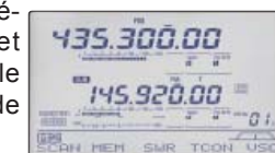
▲Satellite mode screen

Les 20 canaux mémoires satellites alphanumériques disponibles permettent d'enregistrer les fréquences, les modes de modulation et les réglages de tonalité pour un réglage rapide de l'appareil.