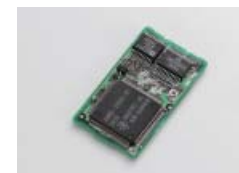
▲Platine UT-121 en option

Le mode DV est disponible en mode simplex sur les bandes 28 MHz et 50 MHz ainsi que sur les bandes VHF et UHF. Profitez des nouvelles possibilités qu'offre le mode DV en DX sur les bandes 28 MHz et 50 MHz. De plus le fonctionnement en mode relais D-STAR (DR) permet l'accès facile aux relais D-STAR.