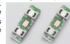
▲FL-430 et FL-431 en option.

L'IC-9100 est doté d'un filtre en toit IF 15 kHz intégré et peut recevoir jusqu'à deux filtres supplémentaires en option (3 kHz FL-431 et 6 kHz FL-430) devant le premier étage d'amplification de FI. Le filtre 3 kHz s'avère particulièrement efficace en modes CW et BLU pour éliminer les surcharges provoquées par les signaux forts, juste en marge de la bande passante.