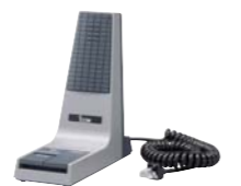
SM-25 : Microphone de table