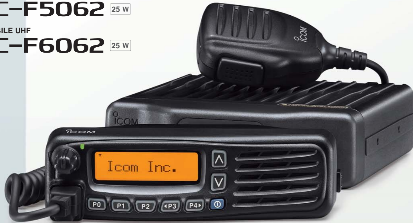
Mobile présenté avec kit optionnel de séparation face avant, RMK-3, et câble OPC-609.