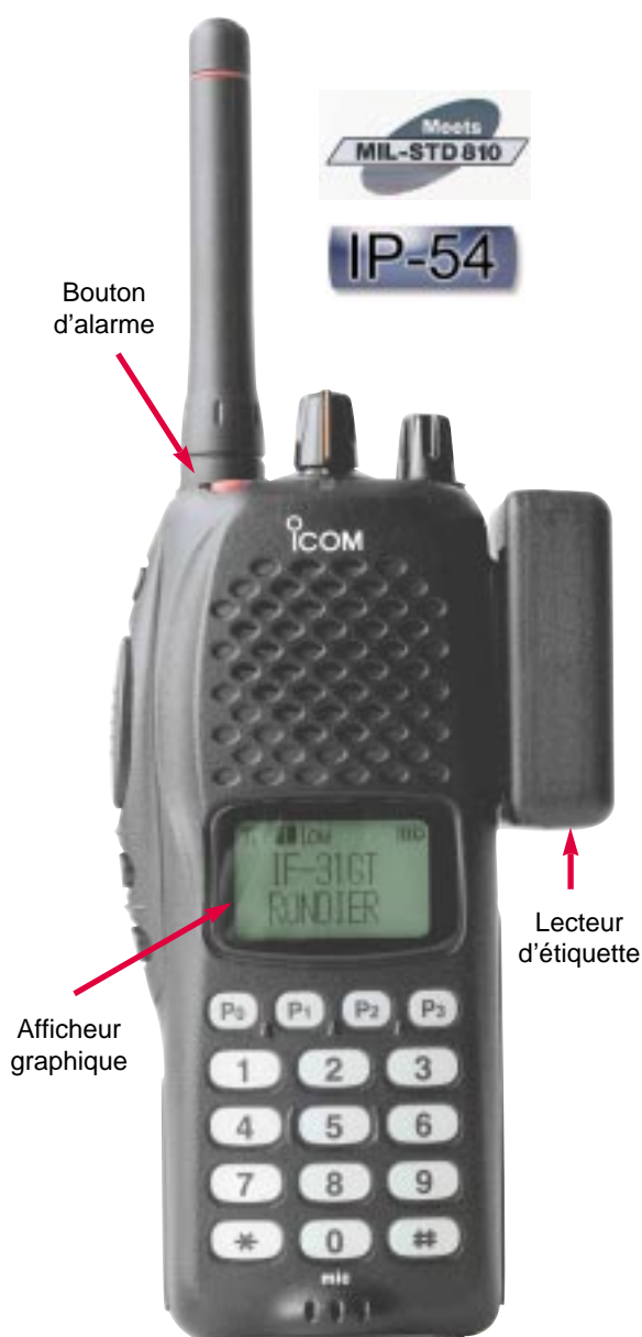
Modèle présenté avec antenne courte

Un filtrage numérique des signaux du capteur permet de supprimer les vibrations en provenance de matériel environnant (ordinateur, etc..).